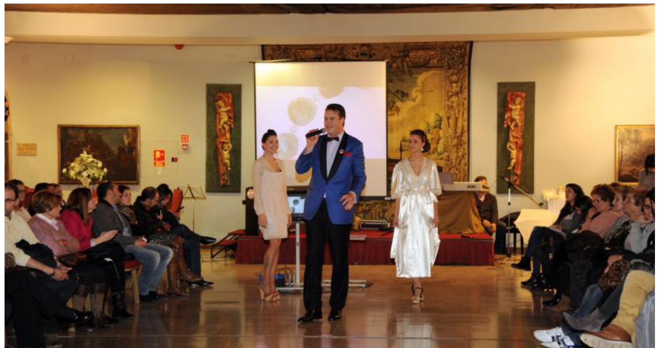
Presentación del desfile del año pasado en el Parador Hostal de San Marcos.

tra ya se ha convertido en una referencia en el sector para la ciudad, por el cuidado de cada detalle y la amplia información que ofrecen a los visitantes, afianzando las expectativas de los que van a casarse y animando a aquellos que aún están indecisos.